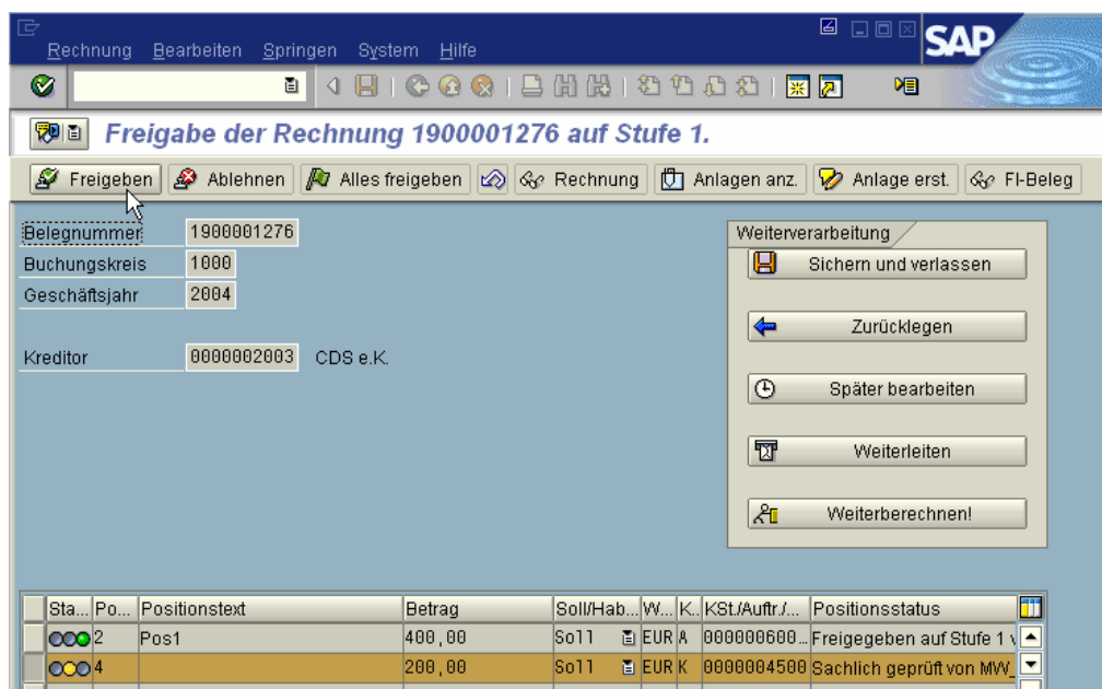
Abbildung 2: Rechnungsfreigabe in SAP

In einem Unternehmen werden Eingangsrechnungen im Rahmen der Bearbeitung oft auf verschiedene Kostenstellen, Aufträge oder andere Kostenobjekte verteilt. Die Freigabe der Rechnungen kann natürlich nur von den jeweils Verantwortlichen für das betreffende Kostenobjekt erfolgen. Betrifft eine Rechnung z.B. zwei oder mehr unterschiedliche Unternehmensbereiche, muss diese auch von mehreren Personen freigegeben werden. Diese Anforderung wird mit dem Workflow Template erfüllt.