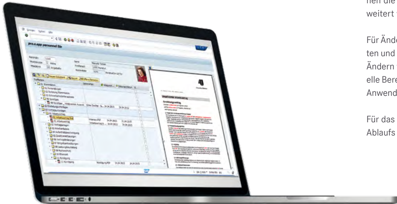
d.velop personnel file for SAP ERP in der SAP-Oberfläche

Für das Entfernen von Dokumenten aus der digitalen Personalakte z.B. aus Gründen des Ablaufs von Aufbewahrungsfristen sind entsprechende Reports verfügbar.