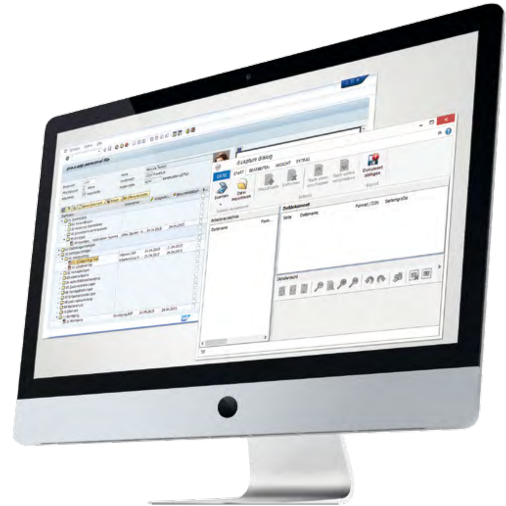
Aufruf von d.capture dialog aus der Personalakte

Für weitere Fragen stehen wir Ihnen gerne zur Verfügung. Greifen Sie hierbei auf eine nachhaltige und praxisorientierte Beratung durch unsere Fachkräfte zurück. Sprechen Sie uns einfach an, denn ein echtes Team besteht aus Menschen.